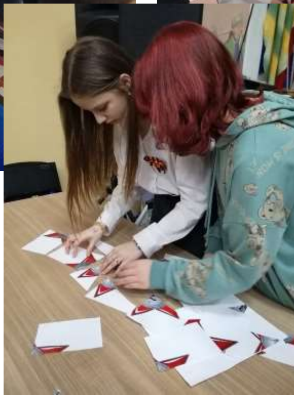
помним!» -актовый зал