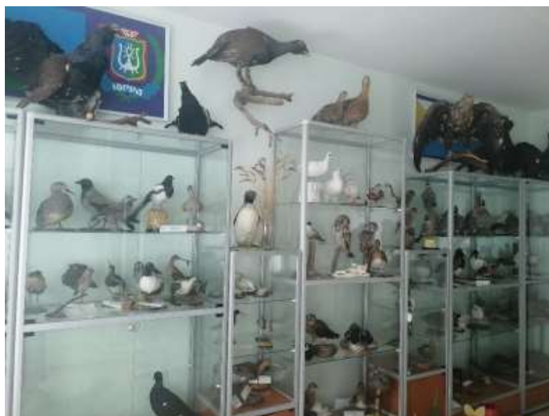
2 станция - «Военные годы» – рекреация, посвященная природе России