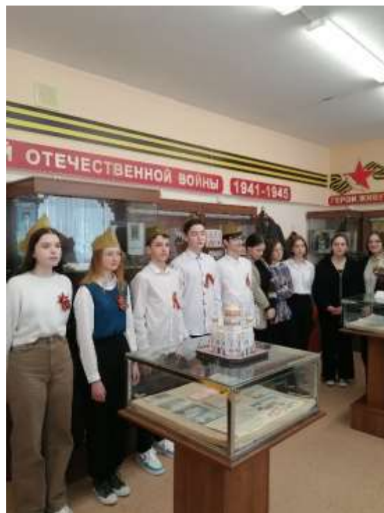
1 станция - «Подрывники, разведчики...» - школьный Музей природы ХМАО-Югры»