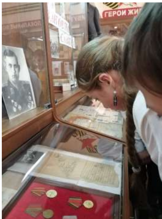
4 станция - «ГОРОДА – ГЕРОИ ВОВ» - зал «Города-герои Великой Отечественной войны»