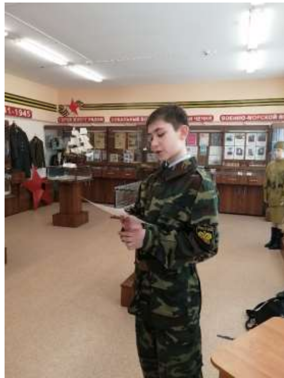
5 станция - «Поклонимся, великим тем годам» - кабинет истории